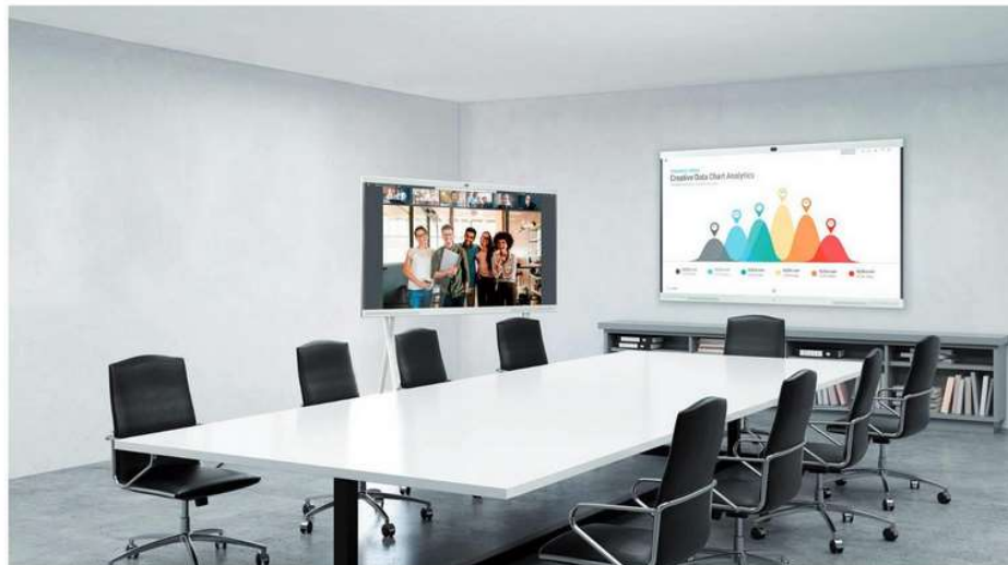
Prednja strana IdeaHub Proa jest imponozantan ekran 4K razlučivosti, s dodirnom površinom, preciznosti 1 mm

sastanka. Istodobno na uređaj može biti spojeno tridesetak korisnika, a zbog toga što prebacivanje s jednog na drugi nije opterećeno posebnim dozvolama i pristancima, podrazumijeva se da jedan drugome neće nasilno oduzimati riječ (sliku).