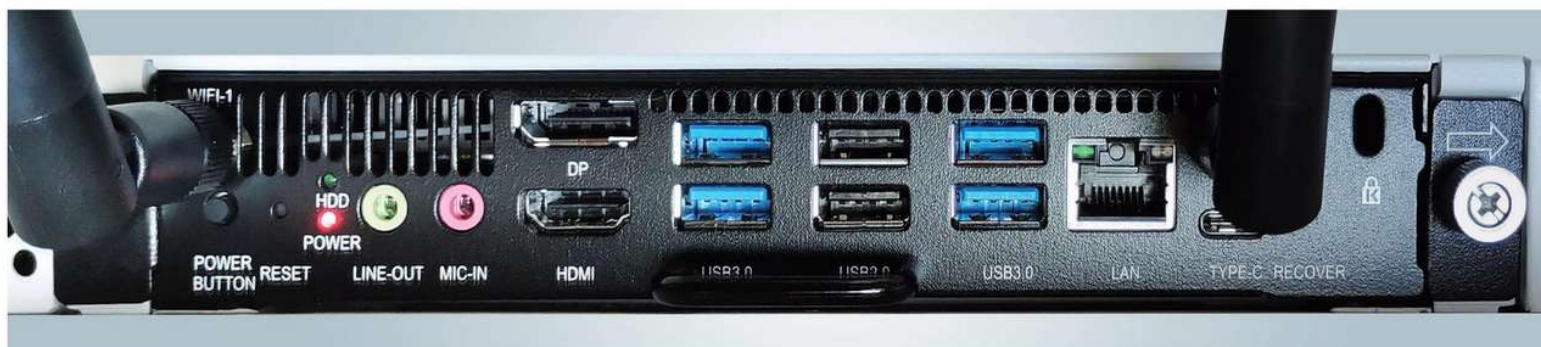
Opcionalni PC modul s obiljem ulaza i izlaza te antenama za Wi-Fi

Vjerojatno je da će IdeaHub Pro svojim funkcionalnostima i vrlo konkurentnom cijenom u svojoj kategoriji svakako izazvati pozornost i postati vrijedan čimbenik učinkovitih sastanaka i prezentacija za male i srednje konferencijske prostorije, naročito u okruženjima koja ne raspolažu IT podrškom, koja je svakako potrebna za sustave koji nisu ovako kompaktni. M